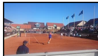
"Team JoKi" har många fina resultat i bagaget.

Sverigeettan Johanna Larsson och holländska dubbelpartnern Kiki Bertens överraskade alla när de i oktober tog sig till final i "den femte Grand Slam-turneringen" – WTA-slutspelet i Singapore. Väl där fick de ge sig i en tuff final mot Timea Babos och Andrea Hlavackova.